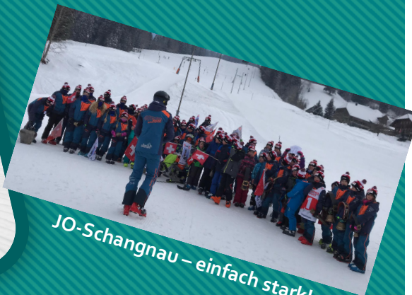
JO-Schangnau – einfach stark!